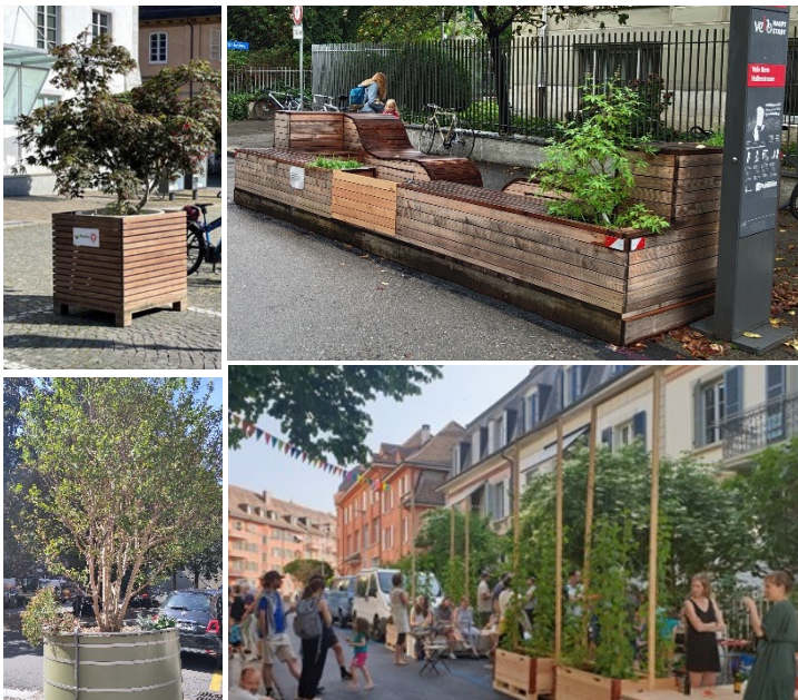
Abbildung 3: Beispielbilder zu Temporärnutzungen

Um den Aufenthalt auf dem Platz angenehm zu gestalten, sollte er gegen die Strasse hin durch beispielsweise eine mobile Baum- oder Buschreihe abgegrenzt werden. Ebenfalls sollte es schattenspendende Installationen wie Sonnenschirme geben. Wichtig ist dabei, dass der Fahrrad- und Fussgängerverkehr den Platz unbehindert passieren kann, dabei aber auch die Sicherheit der Platzbenutzenden gewährleistet ist. Geklärt werden müsste, ob Einsatzfahrzeuge im Notfall diese Strasse nutzen müssen und wie damit umzugehen ist. Ebenfalls zu klären ist die Anlieferung beim Jysk und die Kompatibilität mit den Erdgeschossnutzungen dieses Gebäudes.