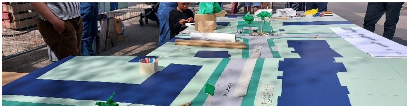
Abbildung 5: Planung mit der Bevölkerung (Bern Muesmatt)

Für Informationen zur AG Natur & Umwelt könnt ihr euch an Vorstandsmitglied Nicolas Erzer wenden.