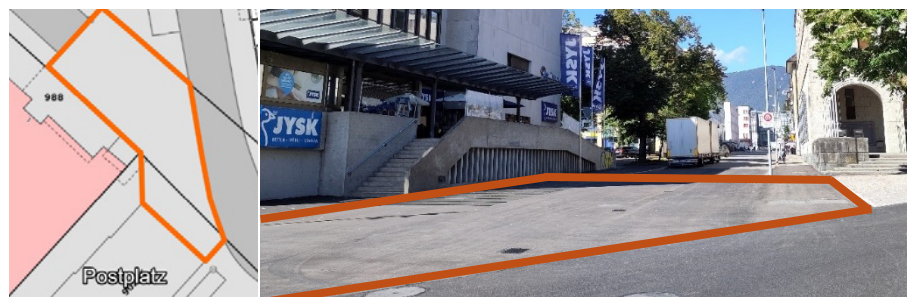
Abbildung 1: Geplanter Perimeter des Projekts