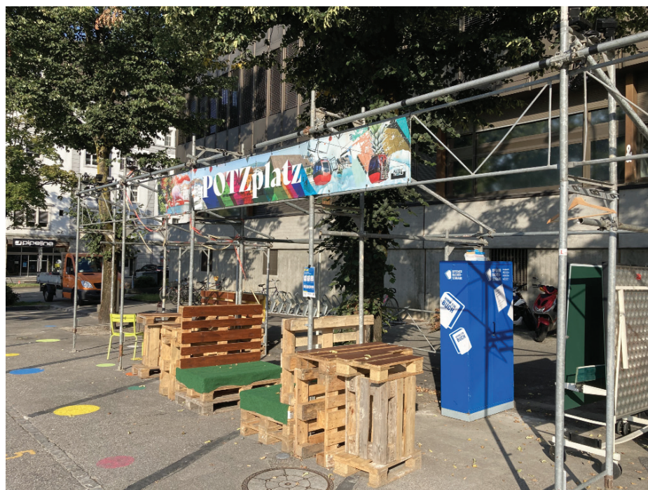
Der «Potzplatz» will während der Zwischennutzung mit Leben gefüllt werden. Und die Linden spenden vorläufig weiterhin Schatten.

Weiter wurde unsere Motion «Beschaffung eines objektunabhängigen Land- und Immobilienkredits von CHF 10 Mio» behandelt. Wir begründeten diese Anliegen vor allem damit, dass die Stadt dadurch eine aktive Bodenpolitik be-